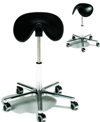
STEPSIT Arbeidssadel med justerbar sittevinkel