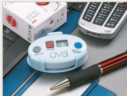
Ova er liten og svært diskret. Mål: 56x34x10 mm

Kliniske prøver har vist at TENS er svært effektivt til behandling av menstruasjonssmerter, uten å ha noen av de bivirkningene som vanligvis forbindes med smertestillende medikamenter, som for eksempel kvalme og trøtthet. Ova er lett å bruke og svært diskret. Den er liten og derfor grei å ha på seg hele dagen. Med Ova kan du holde på med de vanlige aktivitetene dine uten at smertene hindrer deg.