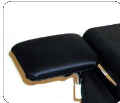
Amputasjonsstøtte. Art.nr: 01055-AH - høyre og 01055-AV - venstre.