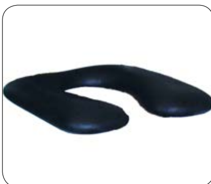
Sete med åpen front, polstret er standard.