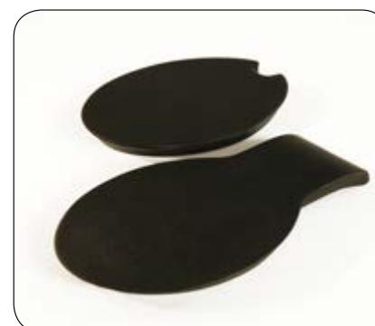
Setelokk kan fås til flere av setene (ikke polstret).