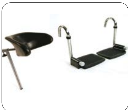
Ergotip 5-6-7-8-9 el leveres med benstøtter, grå bøtte med lokk og nakkestøtte NI som standard. Art.nr: 01055 Benstøtte,par og art.nr Ergo-NI for standard nakkestøtte.