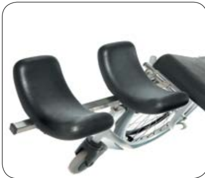
Behagelig polstret leggstøtte til høyre og/eller venstre side. Art.nr. 01056-h/v.