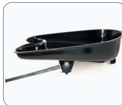
Her vises hårvaskekar. Festes i samme feste som nakkestøtte. Regulerbart og høy kvalitet! Art.nr: ERGO-H.