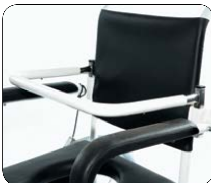
Sikkerhetsbøyle anbefales for alle brukere som ikke har full førlighet i overkroppen. Art.nr. xxxxxx-SB (x= hovedprodukt art.nr).