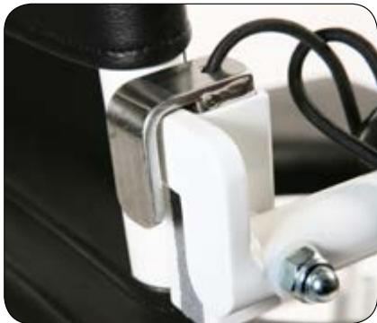
Armlenelås vil sikre at ikke armlenet vippes opp utilsiktet. Enkel i bruk. Art.nr: 01043