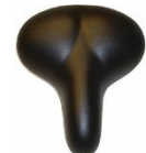
Sykkelsete bred gel