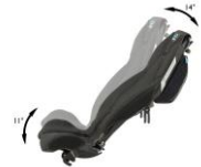
Ergomesh premium sete