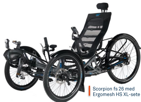
Scorpion fs 26 med Ergomesh HS XL-sete