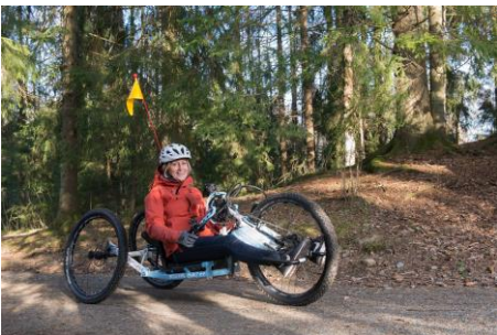
Prashberger Comp CC