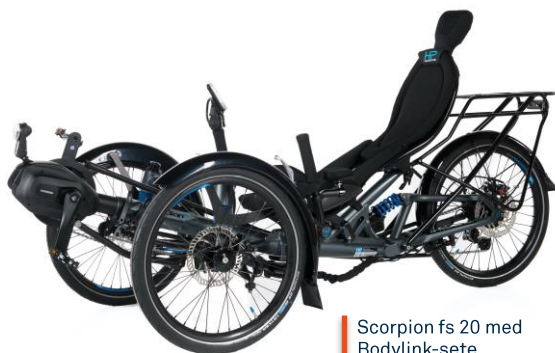
Scorpion fs 20 med Bodylink-sete

Scorpion plus har en høyere sittestilling enn Scorpion fs, noe som forenkler inn- og utstigningen. Selve sykkelen er også noe bredere for å opprettholde stabiliteten pga. forhøyet tyngdepunkt.