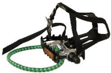
Pedal m/tåhette og strikk