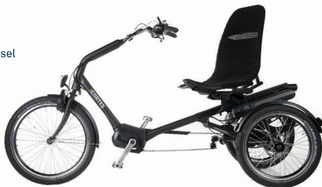
Cortes med utdreid sete