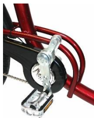
Pedalarm med kneledd