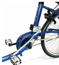
Støtte til stivt ben/protese