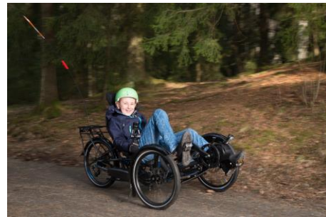
Scorpion fs 20