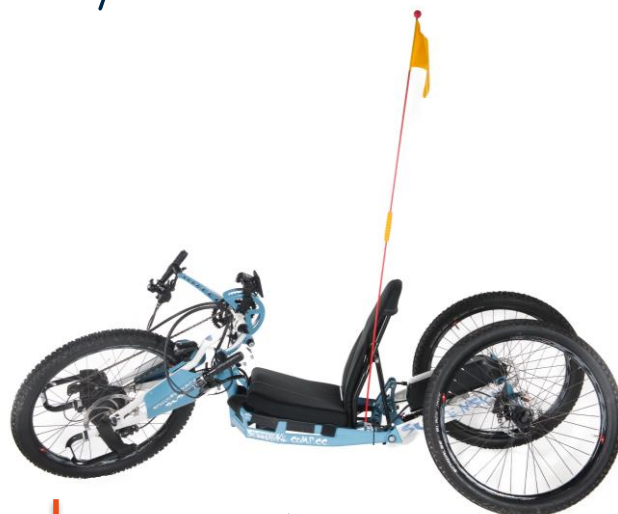
Praschberger Comp CC håndsykkel