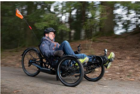
Scorpion fs 26