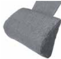
FN105 Dråpeformet stoff FN105-S08 Dråpeformet hud