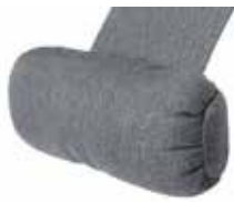
FN103 Stor stoff FN103-S08 Stor hud