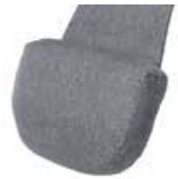
FN100 Std stoff FN100-S08 Std hud