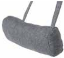
FN102 Liten stoff FN102-S08 Liten hud