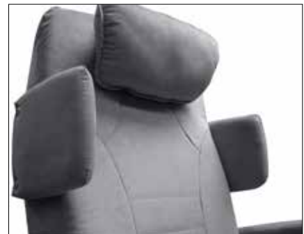
Sidestøtte rygg FN100 Sidestøtte rygg (spesialtilpasning)