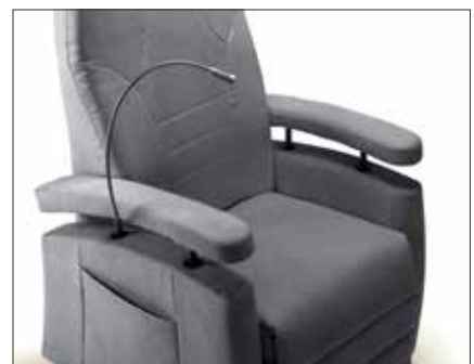
Lys FN185 HMS 195673 Lys Fitform Nordic