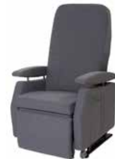
Rygg ekstra myk