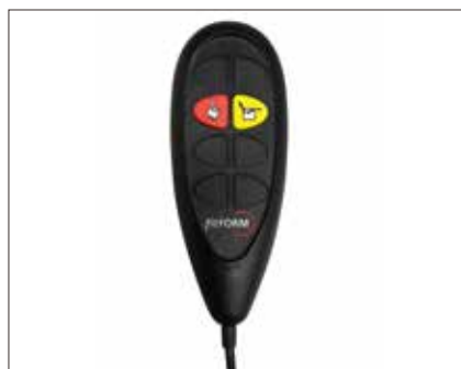
Betjeningsboks Easy FN-EASY Betjeningsboks Easy m 2 knapper og sammenkoplede elfunksjoner

For brukere som synes det er forvirrende med mange knapper på betjeningsboksen. Kan den leveres i en Easy-utgave med kun 2 knapper. Da blir oppreisningsfunksjon, setetilt og benstøtteregulering sammenkoplede. Ryggreguleringen bortfaller (gjelder kun ved nylevering, kan ikke etterbestilles).