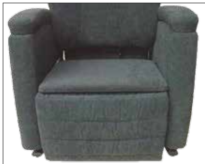
Plansete 200-FN-SPES Plansete Fitform etter mål 201-FN-SPES Plansete Fitform m kant etter mål