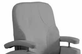
Rygg med sidestøtte

* Ønskes trekk i hud, sett '-S08' etter art nr på trekk. Andre størrelser på forespørsel