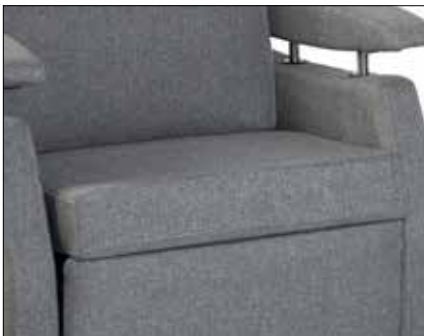
Inkontinensstrekk FN198-sb Inkontrekk sete og benstøtte sb__ FN99-sb Inkontrekk sete sb__ FN98 Inkontrekk rygg etter mål FN149-sb Trekk sete Sarcotex sb__