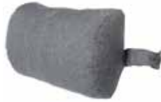
FN104 Med bånd stoff FN104-S08 Med bånd hud