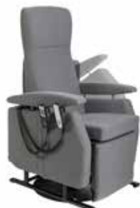
Sidevange oppfellbar, elektrisk betjent