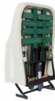
Leddet ryggramme som kan vinkles to steder på hver side kombinert med justerbar rem regulering