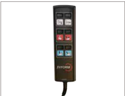
Betjeningsboks lettbetjent Svært lettbetjent betjeningspanel FN187 HMS 195659 Betjeningsboks Light Touch Fitform lettbetjent (Linak)