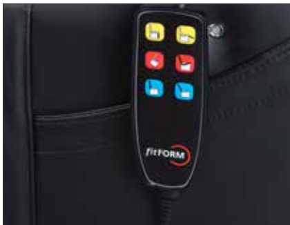
Betjeningsboks standard FN505 Betjeningspanel std stol m tilt FN506-1 Betjeningspanel std stol u tilt