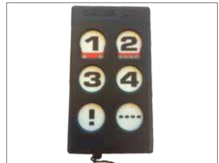
IR-styring FN-GW Betjoks til IR styring Fitform trådløs lett- betjent mod Gewa (krever FN-IR) FN-NETT B Nettbrett til IR styring Fitform (krever FN-IR) inkl programmering FN-CIAR Tillegg CIAR elektronikk for IR styring Fit- form Nordic (kun fabrikkmontert) Stolen kan også styres med omgivelseskontroll f.eks Rolltalk