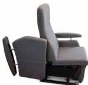
Sidevange oppfellbar, manuelt betjent