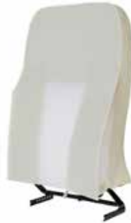
Ekstra mykt skum i senter av rygg

Rygg med ryggskum med sidestøtte, samt regulerbar korsryggstøtte. For brukere med moderat behov for støtte, men ellers ingen behov for posisjonering