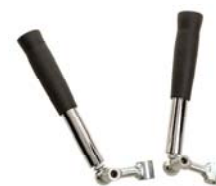
Håndtak med el kontroll