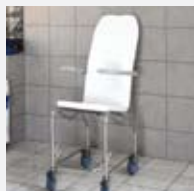
Dockningsbar stol med hjulförsett chassi