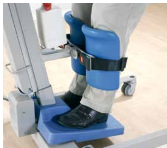
Fotplaten gir maksimal sikkerhet og stabilitet mens knestøtten gir naturlig ankelbøyning.