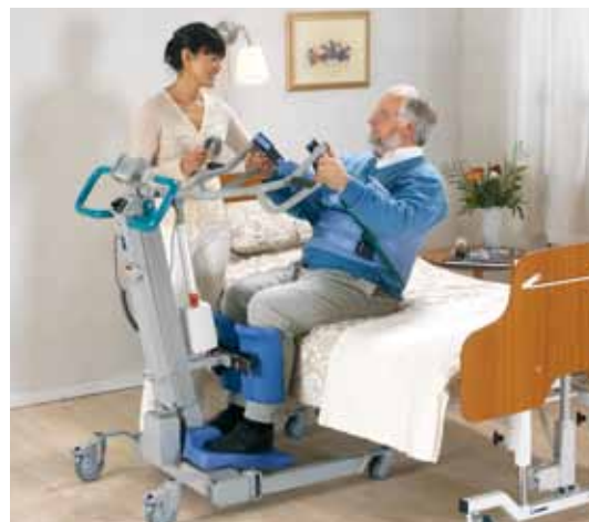
Med SARA 3000 kan én pleier løfte beboeren opp i stående stilling, sikkert og behagelig.

SARA 3000 gjør arbeidet lettere for pleierne. Den krever ingen manuelle løft, og én pleier kan dermed utføre trygge forflytninger. Den løfter beboeren til oppreist stilling samtidig som den gir maksimal støtte for overkroppen. Den ergonomiske utformingen gjør at SARA 3000 er enkel og behagelig å betjene og styre. Enkel betjening ved hjelp av håndkontroll eller betjeningspanel på masten gir trygg og effektiv forflytning, så pleieren kan konsentrere seg mer om å oppmuntre beboeren til å bidra aktivt i forflytningen.