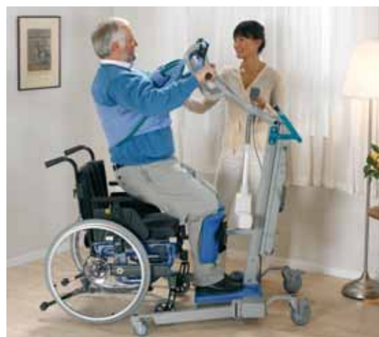
Forflytning til rullestol skjer smidig og med full kontroll.