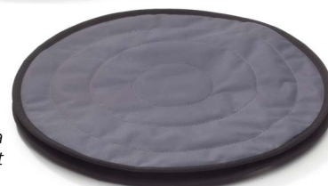
Immedia HandySwing Seat