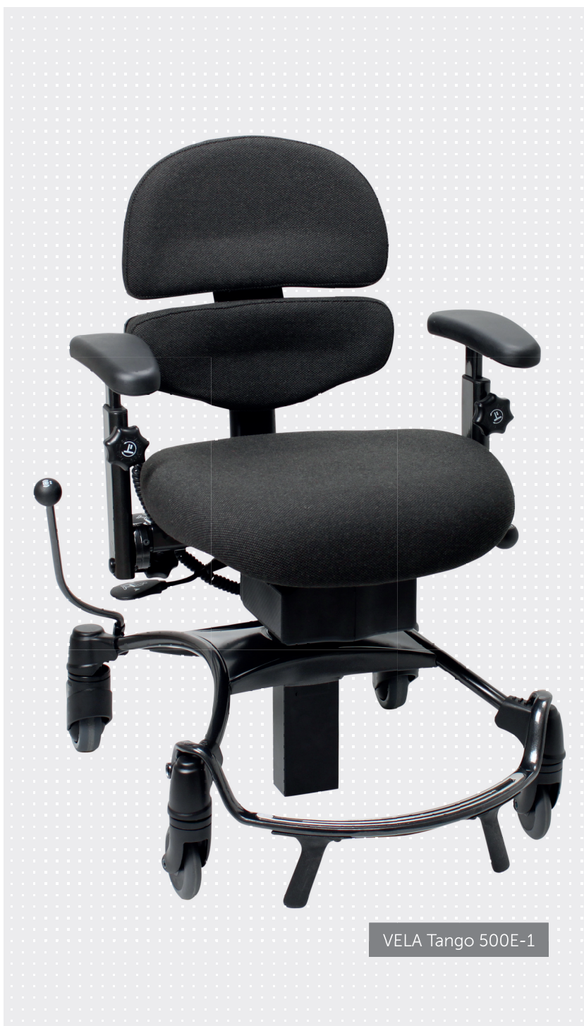
VELA Tango 500E-1

VELA Tango 500E er en arbeidsstol med elektrisk seteløft, setetilt, seterotasjon og ergonomisk sitteenhet. Stolen har helt ny, todelt aktiv rygg som gir meget god støtte i korsryggen. ALB ryggen gir brukere mer støtte ved en aktiv arbeidsstilling i ulike arbeidshøyder. Stolens rygg- og setetilt fremover, fremmer en aktiv sittestilling og deltagelse i hverdagsaktiviteter. Sentralbrems gir en trygg og stabil sitteplass ved aktiviteter i kjøkkenet, og gir sikkerhet når brukeren reiser – setter seg. Seterotasjon kan være en hjelp ved forflytning, og til enkelt og trygt sitte inntil bord. De lettrillene hjulene gjør stolen lett å «gå frem» mellom ulike aktiviteter.