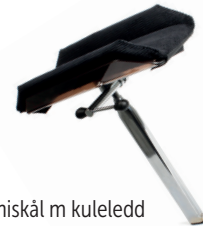
Armlen hemiskål m kuleledd