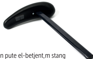
Armlen pute el-betjent, m stang