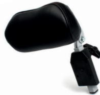
Nakkestøtte stor, til rygg CY, ES5, T3