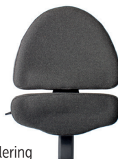
Rygg ALB, aktiv regulering

Brukes kun for disse stoler: VELA Tango 100-serien