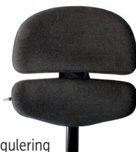
Rygg ALB, aktiv regulering

Brukes kun for disse stoler: VELA Tango 500-serien