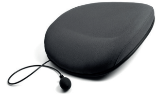
Rygg CY med korsryggluftpute