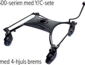
Understell med 4-hjuls brems