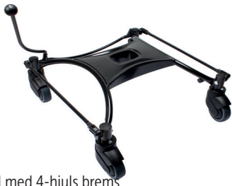
Understell med 4-hjuls brems

Brukes kun for disse stoler: VELA Tango 100-serien