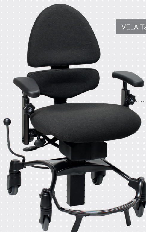
VELA Tango 500E-2