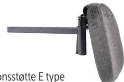
Amputasjonsstøtte E type