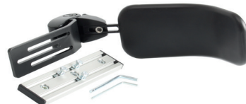
Kroppsstøtte ES5 rygg