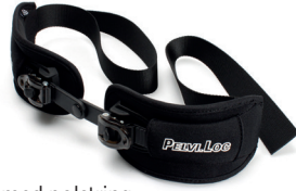
Hoftesele med polstring