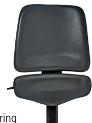
Rygg ALB, aktiv regulering

Brukes kun for disse stoler: VELA Tango 100-serien