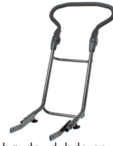
Kjørebøyle høyde- dybderegulerbar