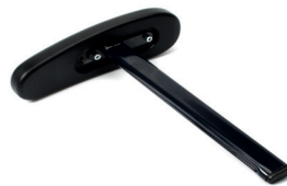
Armlen pute m stang, std (31cm) - lang (41cm)