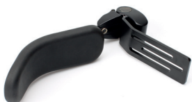
Kroppsstøtte med buet pute

Brukes kun for disse stoler: VELA Tango 100-serien