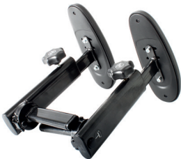
Armlenesett nedfellbare Tango 100 serie