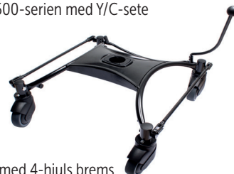
Understell med 4-hjuls brems