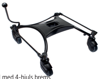
Understell med 4-hjuls brems

Brukes kun for disse stoler: VELA Tango 100-serien