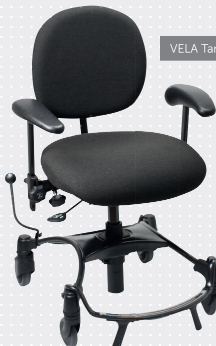
VELA Tango 100F-3

VELA Tango 100F-1 til brukeren som har behov for en mindre sitteenhet