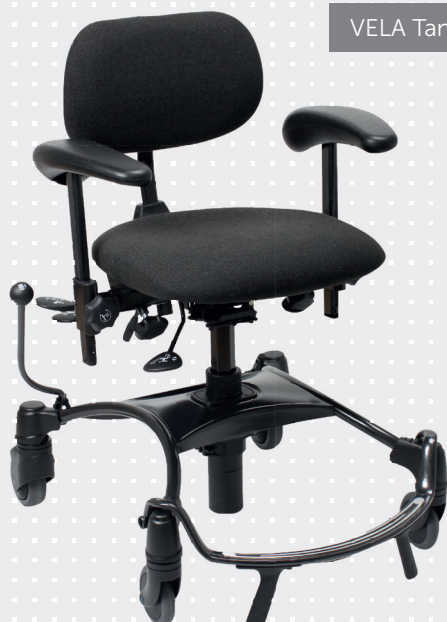
VELA Tango 100F-1