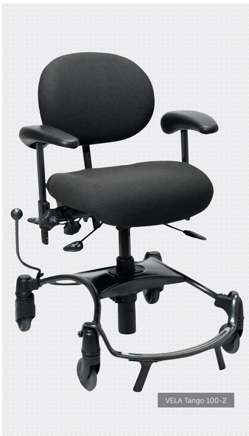
VELA Tango 100-2

VELA Tango 100 er en arbeidsstol med manuelt seteløft, setetilt, seterotasjon og ergonomisk sitteenhet. Stolen fremmer en aktiv sittestilling, deltagelse i hverdagsaktiviteter i hjemmet og på arbeidsplassen. Sentralbrems gir en stabil sitteplass ved aktiviteter på kjøkkenet, og gir sikkerhet når brukeren reiser – setter seg. Rotasjon kan være en hjelp til enkelt og trygt å kunne sitte inntil bord, og de lettrillene hjulene gjør stolen lett å «gå frem» mellom ulike aktiviteter, så brukeren blir mer selvhjulpent.