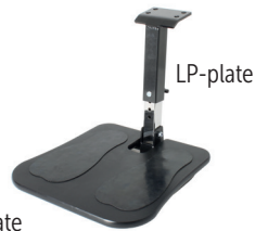
Fotstøtte 17° med plate

Brukes kun for disse stoler: VELA Tango 100-serien