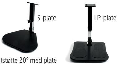
Fotstøtte 20° med plate