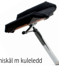
Armlen hemiskål m kuleledd