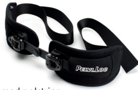
Hoftesele med polstring