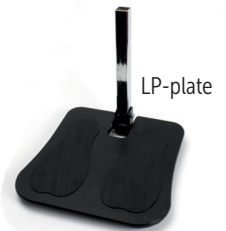
Fotstøtte 8° med plate

Brukes kun for disse stoler: VELA Tango 500-serien med Y/C-sete