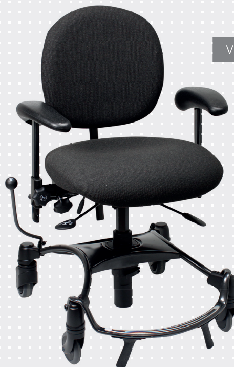
VELA Tango 100-3

VELA Tango 100-1 til brukeren som har behov for en mindre sitteenhet.