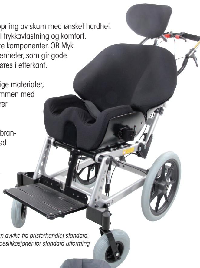
Bildene kan avvike fra prisforhandlet standard. Se egne spesifikasjoner for standard utforming