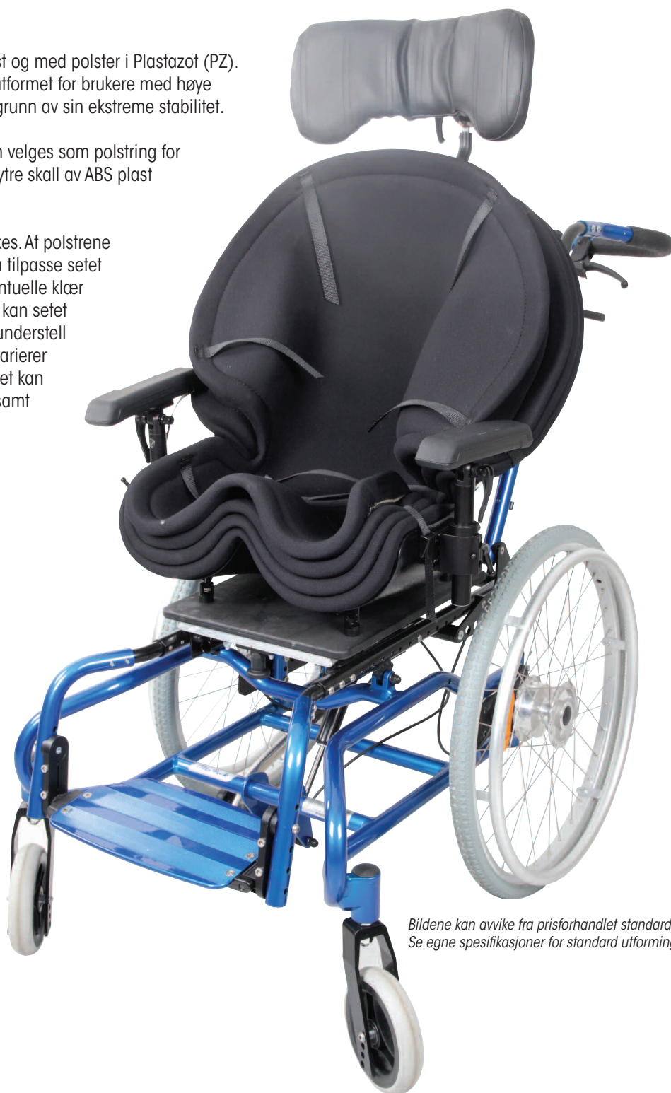
Bildene kan avvike fra prisforhandlet standard. Se egne spesifikasjoner for standard utforming