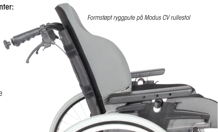
Formstøpt ryggpute på Modus CV rullestol

Dette er kun noen av eksemplene av det som er mulig. Ta kontakt med oss for å finne en løsning som utnytter det beste fra både standard-produkter og spesialproduserte formstøpte enheter.