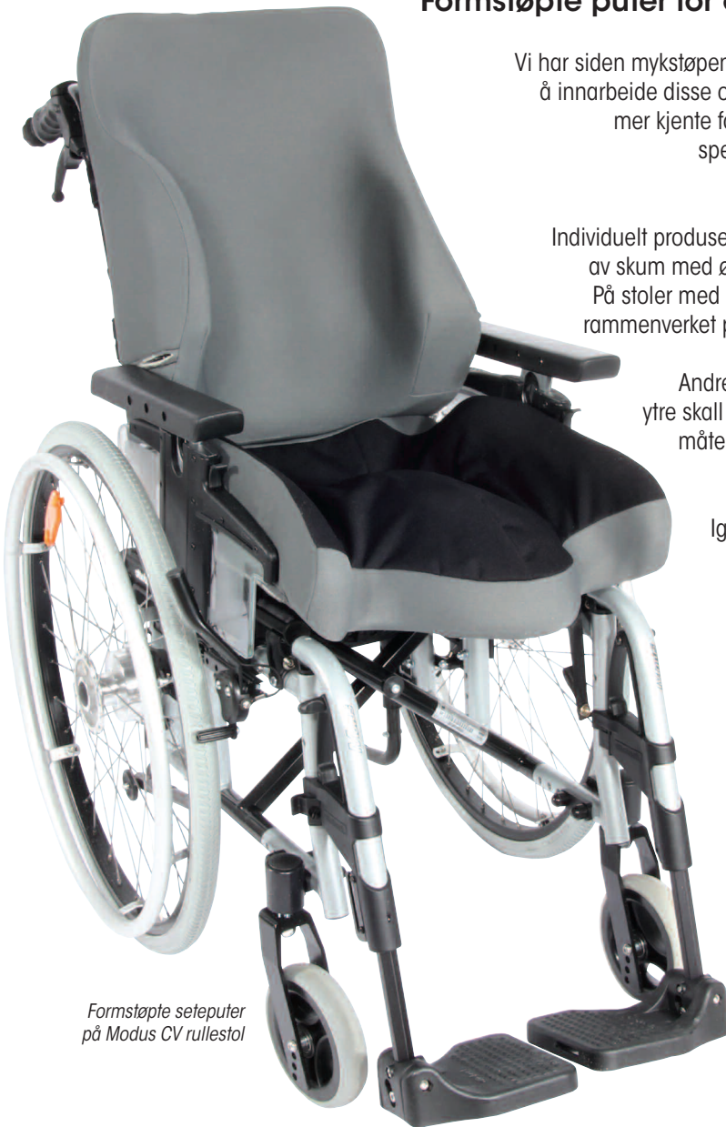
Formstøpte seteputer på Modus CV rullestol

Setets overflate kan behandles med en slitesterk, vannnett membran materiale kalt Superskin, for å lette håndteringen/ rengjøring med hensyn til smuss og inntrenging av fuktighet i skumputene.