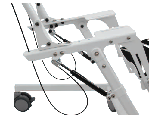
Trinnløs 35° tiltbar vinkeljustering på HM Hygieneunderstell