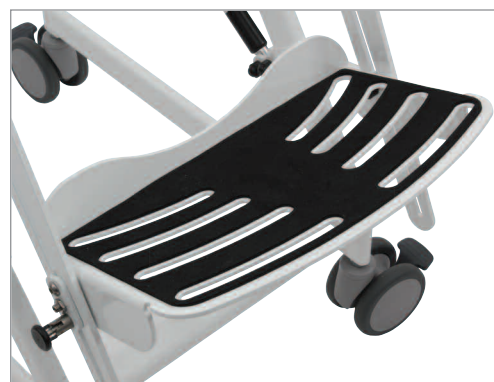
Justérbart fotbrett på HM Hygieneunderstell