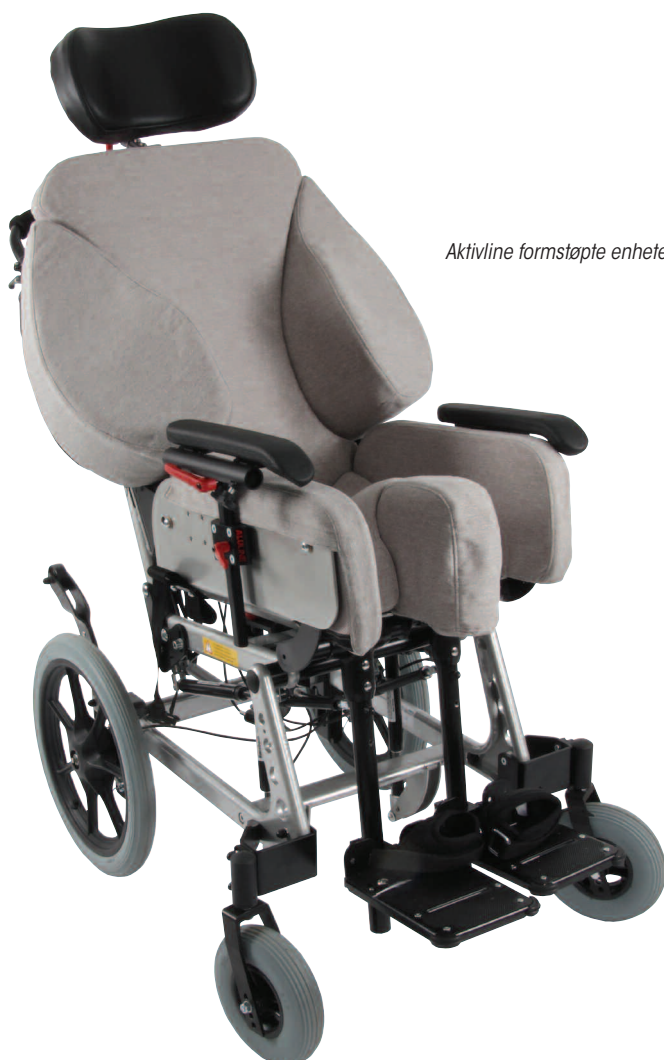
Aktivline formstøpte enheter

TinTin kan monteres på hofteledd og kneledd, samt at vi med teknologien fra våre Aktivline stoler kan levere dynamiske hodestøtter og dynamiske fotbrett.