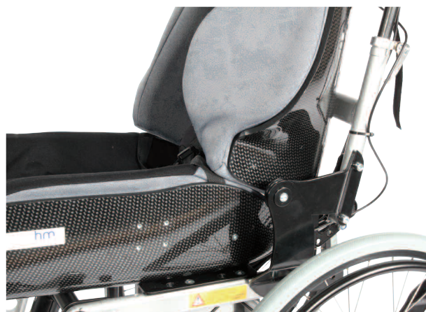
Tin-Tin hofteledd for formstøpte enheter