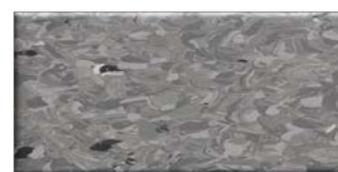
Standard gray 304038