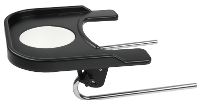
Bord med balje til Ella