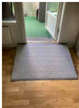
SecuCare terskeleliminator med 1-sidig påkjøring