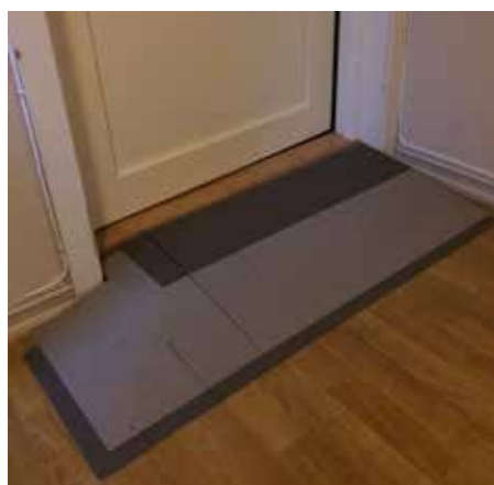
SecuCare terskeleliminator med 2-sidig påkjøring