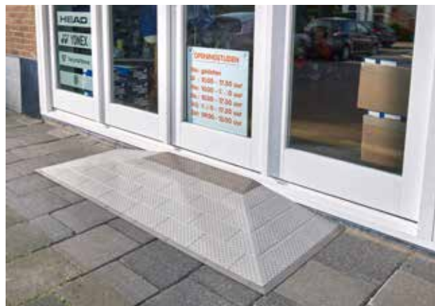
SecuCare terskeleliminator med 3-sidig påkjøring