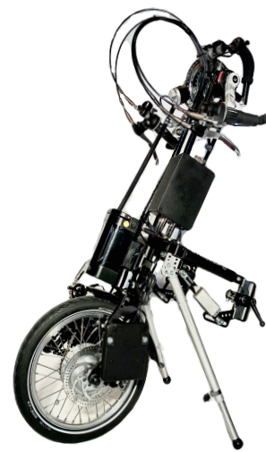
Lipo Smart Para

Sykkelfronten leveres med et 300W 8,3ah litiumbatteri som er tillatt for fly. Finnes i voksen, ungdom og barnemodell.