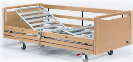
► Invacare® SB 755