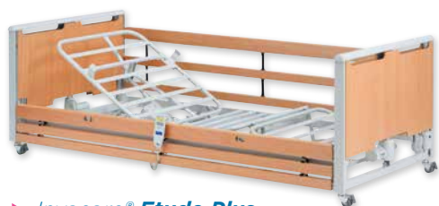
► Invacare® Etude Plus