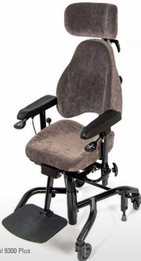
Real 9300 Plus