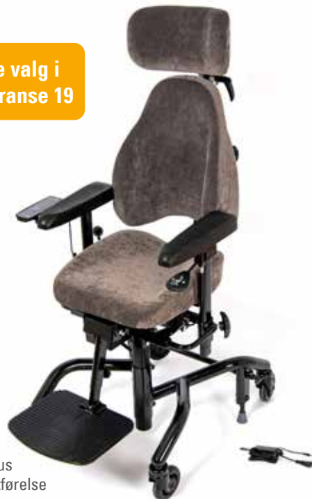
Real 9400 Plus i standard utførelse