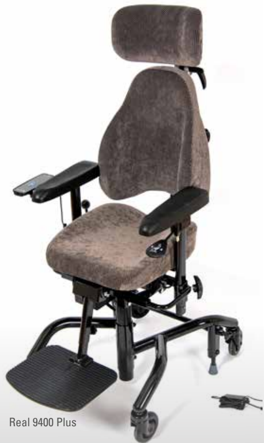
Real 9400 Plus

Arbeidsstolen for aktivitet, støtte og hvile