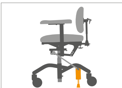
Brems mot gulv gir tryggere forflytning.