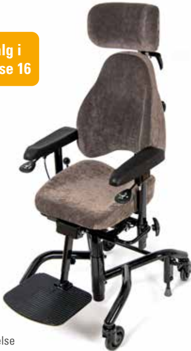
Real 9300 Plus i standard utførelse