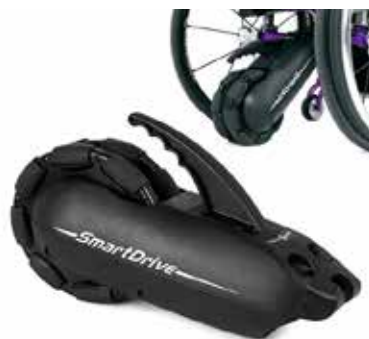
SmartDrive brukerstyrt drivaggregat.