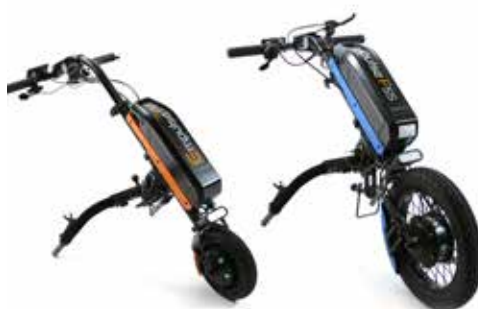
Empulse F55 Drivaggregat med manuell styring.