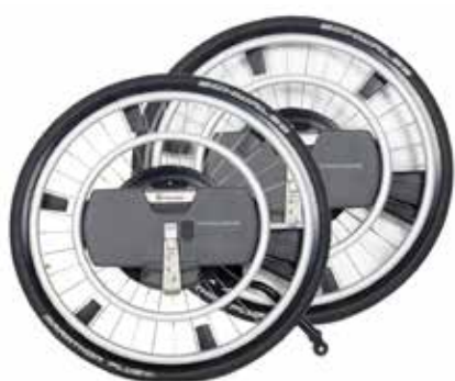
Empulse WheelDrive Drivhjul med elektrisk motor.

Les mer om drivaggregater på vår hjemmeside www.SunriseMedical.no eller i vår katalog Manuelle rullestoler og drivaggregater.