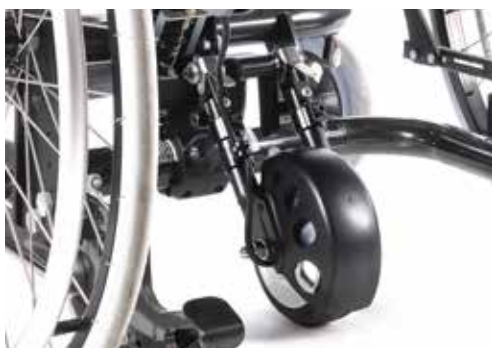
Empulse R20 ledsagerstyrt drivaggregat.