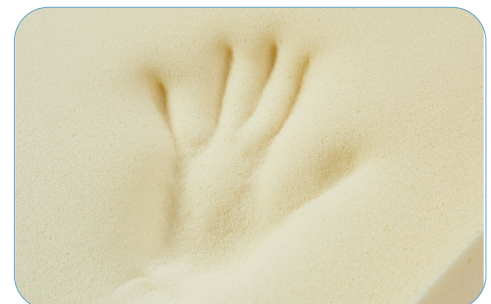
Skumkjernen består av trykkavlastende viskoelastisk spesialsikum.