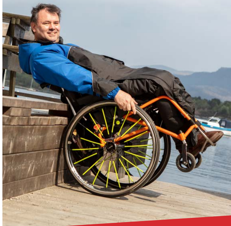
A tilla - www.aillaa.no