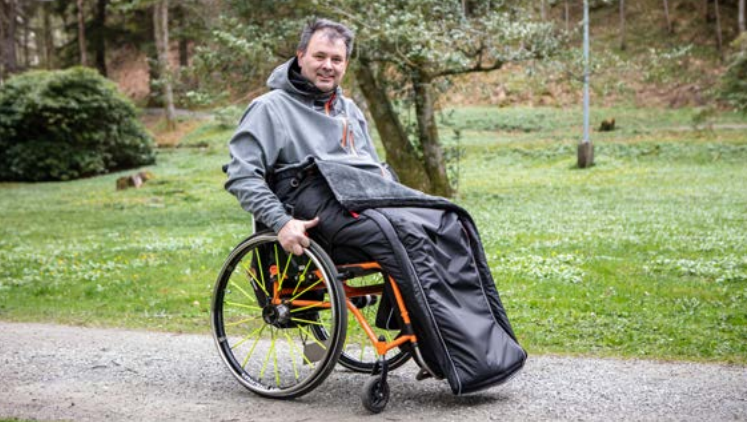
Art.nr. vinter 350-00 | sommer 350-04