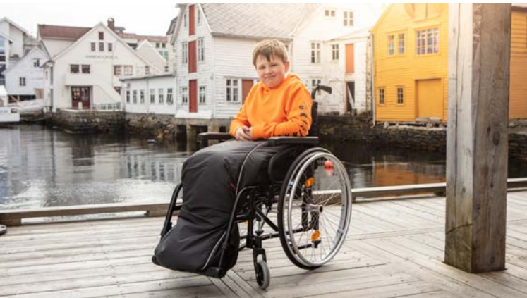
Art.nr. vinter 360-00 | sommer 360-04