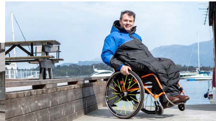
Art.nr. jakke 327 | bukse m.sete 326 | bukse u.sete 346