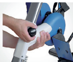
Flere justeringsmuligheter kan stilles uavhengig av hverandre.