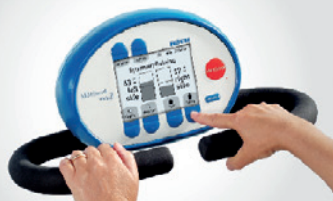
Display med med en rekke terapi- og motivasjonsprogrammer.