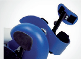
Fotskåler med leggstøtte og borrelåsfester.