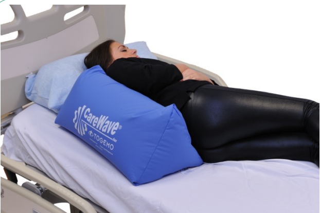
Puter i bruk: NEG0607, NEG0944

Merk at den lange trekantputen 5-NEG1079 ikke er prisforhandlet med NAV.