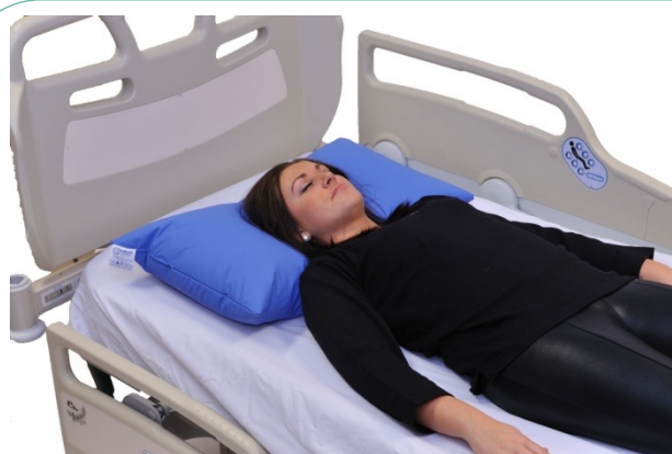
Puter i bruk: NEG0944

Universalputene kan utmerket brukes som hodepute. Velg rett størrelse til den enkelte pasient slik at fyllingsgrad og størrelse gir ønsket stabilitet. Universalputene kan brukes like bra for stabilisering av hode og nakke i ryggleie, korrigerende sideleie og sideleie. Det vil nesten alltid være en fordel å utstyre puten brukt som hodepute med tilhørende bomullstrekk. I produktlisten finner du artikkelnummer og NAV sitt hjelpemiddelnummer.