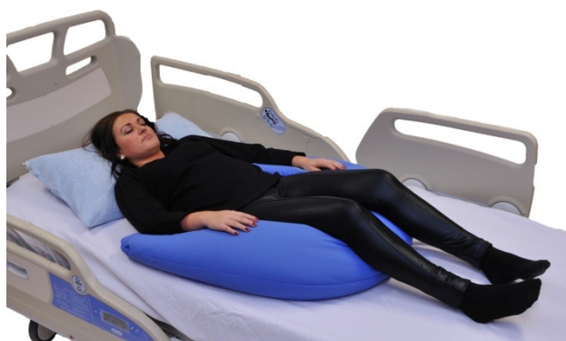
Puter i bruk: NEG0608, NEG0944

Bueputen er her lagt slik at vi får en nøytral posisjon i hofte og kneledd. Samtidig er buens ender skjøvet inn under siden av setepartiet og vil således stabilisere bekkenet. Enden på bueputen ligger også slik at den gir support for underarmene. En universalpute med bomullstrekk er brukt som hodepute.