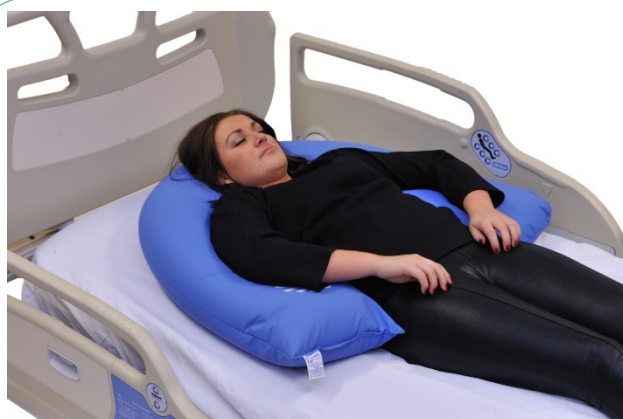
Puter i bruk: NEG0608

NEG0947 gir slik vist på bildet god symmetri, og rett midtlinje, og er brukt for samtidig å gi pasienten nøytral posisjon i hofte, - og kneledd. Bildet over viser hvordan armene stabiliseres, og løsningene kan ofte med fordel kombineres.