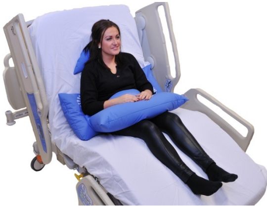
Puter i bruk: NEG0606, NEG0944, NEG0942, NEG0946

I sittende posisjon kan med fordel NEG0606 2-pack brukes for å fiksere bekkenet. Dette vil stabilisere bekkenet i ønsket sittevinkel, og forbygge tilting av bekkenet slik at pasienten ender i "banan" posisjon. NEG0942 er brukt øverst thorakalt for å gi pasienten bedre support for bedre å kunne bære hodet. Den er også plassert slik at den gir stabilitet for nakken. NEG0944 er lagt i fanget for å stabilisere armene via support i underarmene. En buetepute kunne også vært brukt i fanget.