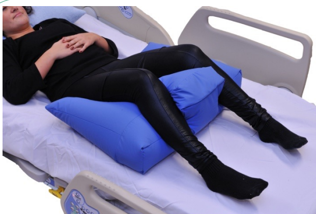
Puter i bruk: NEG0611

Semi-fowlerputene kan brukes i mange sammenhenger. Her vist for å nøytralisere kne og hoftelodd, for å oppnå abduksjon, og lagt slik at "armene" på puten skyves under setet for å fiksere og skape stabilitet i bekkenregionen.