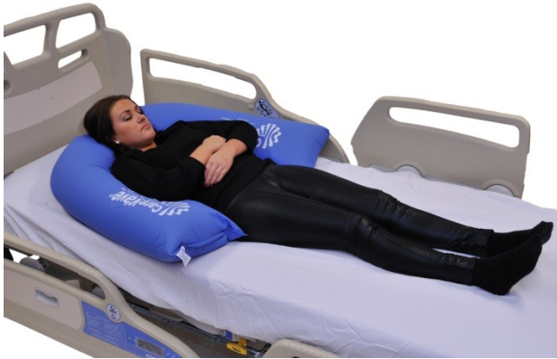
Puter i bruk: NEG0610

Her er S-puten rotert slik som på forrige bilde og lagt slik at buen går rundt pasientens øvre del. Hode og nakke gis god support, og armene bringes inn mot kroppen for å gi trunkusstabilitet.