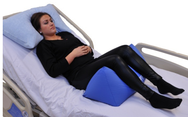
Puter i bruk: NEG0607, NEG0944

Trekantputene er ypperlige for å oppnå en stabil og nøytral posisjon for hofte og kneledd. NEG0887 gir for vår modell en relativt liten vinkel, men størrelse må velges utfra det individuelle behov.