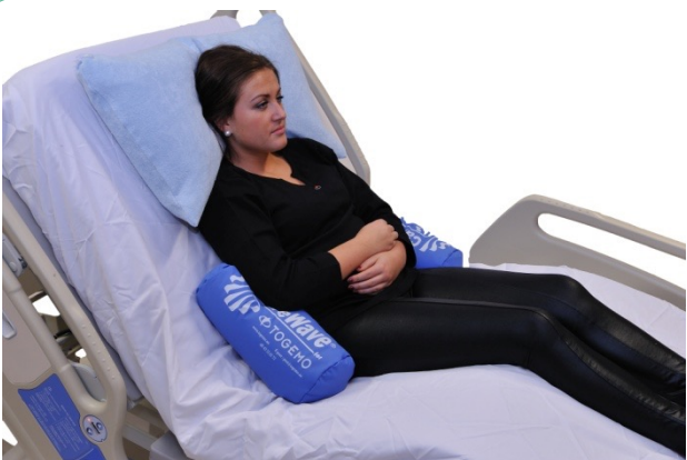
Puter i bruk: NEG0614, NEG0944

2-pack sylinderputer brukt i den hensikt å forhindre overstrekk av kneledd. Bør brukes i et dynamisk program slik at leddvinkler endres rutinemessig. Med denne kombinasjonen kan en også gi noe individuell vinkel på hvert kne ved å "bearbeide" polystyrenkulene i puten,