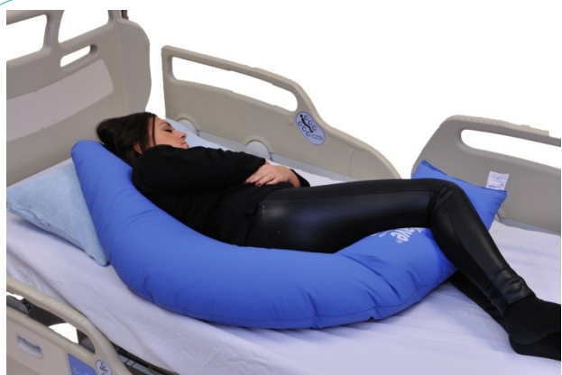
Puter i bruk: NEG0608, NEG0944

En buepute i fanget gir meget god trunkus stabilitet, og NEG0941 gir samtidig en stor flate for å stabilisere armene. Her sitter modellen i sengen med tanke på å kunne stimulere til aktive bevegelser spesielt for hendene. En universalpute med bomullstrekk er benyttet for å stabilisere nakke og hode.