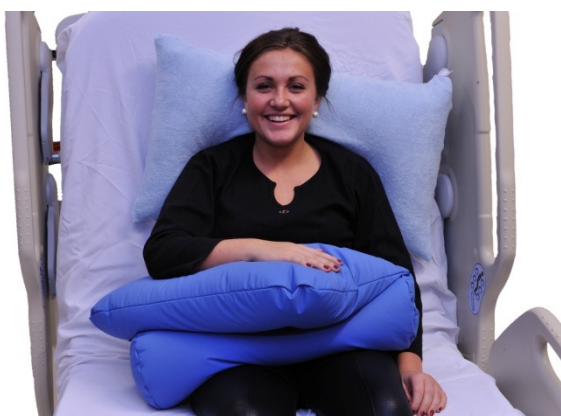
Puter i bruk: NEG0732, NEG0944

Hemi-armputene (her vist med den største) er meget velegnet for slagpasienter med delvis eller total halvsidig lammelse. Puten består av to deler som festes med borrelås slik at vinkelen på den øverste puten kan tilpasses individuelt.