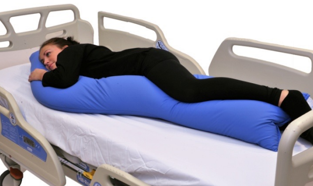
Puter i bruk: NEG0610

Her er den største S-puten brukt på vår modell som er 160 lang. Vi ser at puten gir samme stabile posisjon, men er noe overdimensjonert. Dersom putens størrelse brukt i andre posisjoner er hensiktsmessig oppnår en ønsket resultat selv om puten i utgangspunktet for korrigert sideleie er for stor. En generell regel bør være at det er bedre å velge en for stor pute enn en for liten pute. Brukes en for liten pute kan raskt behov for en tilleggspute komme.