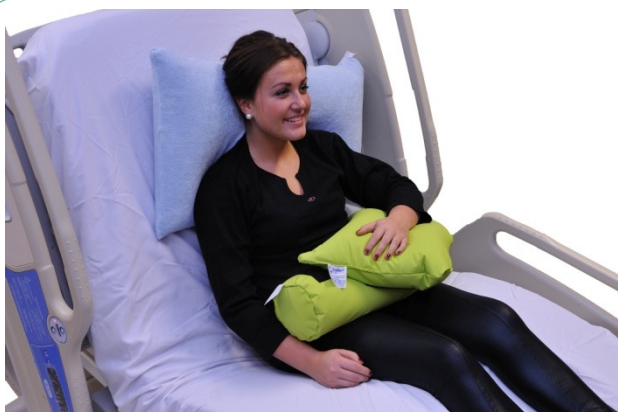
Puter i bruk: NEG0889, NEG0944

Hemi-armputene (her vist med den største) er meget velegnet for slagpasienter med delvis eller total halvsidig lammelse. Puten består av to deler som festes med borrelås slik at vinkelen på den øverste puten kan tilpasses individuelt.