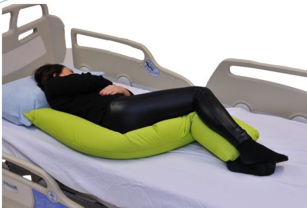
Puter i bruk: NEG0883, NEG0944

Her er S-puten rotert slik som på forrige bilde og lagt slik at buen går rundt pasientens øvre del. Hode og nakke gis god support, og armene bringes inn mot kroppen for å gi trunkusstabilitet.