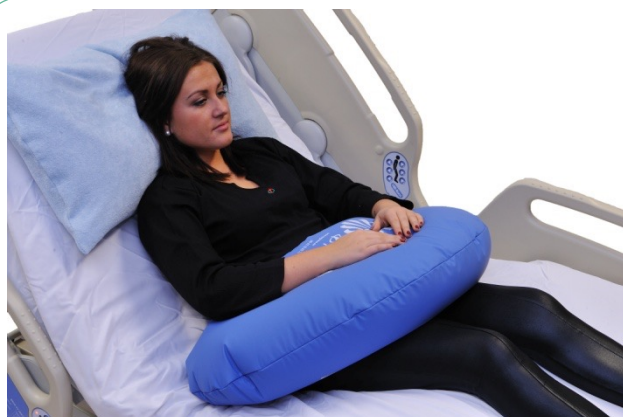
Puter i bruk: NEG0947, NEG0944

Korrigert sideleie, eller 30 gradersleie, kan på en enkel måte oppnås ved bruk av en buepute i rett størrelse. Her er NEG0608 valgt fordi den i tillegg til å stabilisere i korrigert sideleie også stabiliserer nakke og hode, samt at den er trukket opp mellom bena. På denne måten skapes symmetri og rett midtlinje ved bruk av bare en pute.