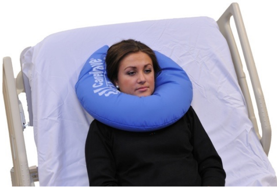
Puter i bruk: NEG0612

Putene med lukking kan gjerne brukes med åpningen i andre vinkler enn i pasientens synsretning. Her forsøker vi å illustrere en pasient med behov for support inder haken i tillegg til sideveis.