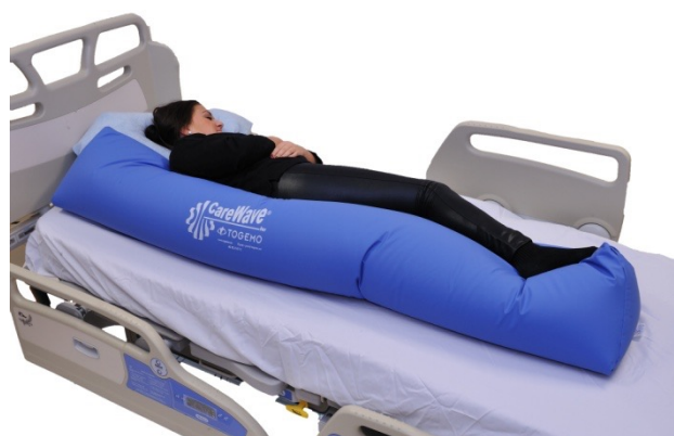
Puter i bruk: 5-NEG1079, NEG0944

Trekantputene er ypperlige til å stabilisere i korrigeret sideleie. Her er den største brukt i strak kroppsposisjon, med det høyre benet plassert noe opp på puten for å skape en rett midtlinje og en symmetrisk posisjon. I tillegg til trekantputen kunne en buepute vært brukt for å stabilisere armene, og gi en nøytral posisjon for albue og skulderledd.