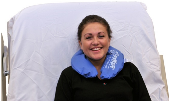
Puter i bruk: NEG0950

Ønsker en support spesielt mot en av sidene kan en bearbeide polystyrenkulene ved å riste massen mot den ene siden av puten, og legge den litt skjevt slik vist på bildet.