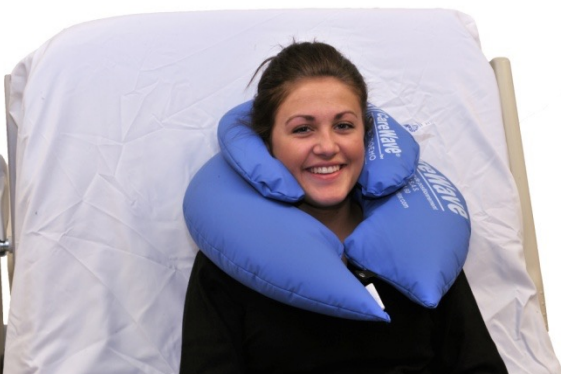
Puter i bruk: NEG0612, NEG0950

5-NEG0950 er vår minste nakkepute, og har som hovedfunksjon å fylle det tomrommet som alltid kommer i nakkeregionen. Puten egner seg i sittende, og i liggende. Enten alene eller sammen med andre puter