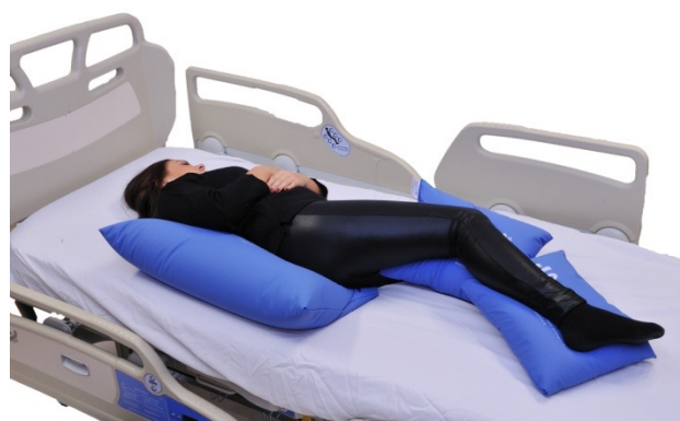
Puter i bruk: NEG0944, NEG0606

Her har vi vist hvordan universalputene S kan stabilisere bekkenet i ryggleie, samtidig som universalputen 2XL gir både hofte og kne nøytral posisjon. Putene lagt på hver side i bekkenregionen dyttes så langt inn fra siden at kroppens vekt former puten. Slik gis god sidestabilitet for bekkenregionen. Her er det ikke gjort noe for å stabilisere eller nøytralisere armene, men en buepute ville kunne fungere godt om situasjonen krever det. Inspeksjon av hæler er viktig når en benytter slik kne vinkel som vist. Hodepute kunne her også vært brukt.