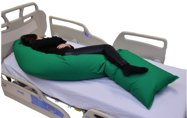
Puter i bruk: NEG1030 (puten kommer nå i blå farge)

Vår modell er 160 cm lang og en ser at når den minste S-puten brukes oppnås samme kontrollerte posisjon i korrigert sideleie, men puten gir ikke support for føttene og for hodet. Valg av riktig størrelse er avhengig av pasientens individuelle situasjon, men en må hver gang gjøre en bedømmelse av hvilken størrelse som vil gi mest optimal posisjon og stabilitet. I tillegg til S-pute er det her brukt en universalpute med bomullstrekk for nakke og hode support.