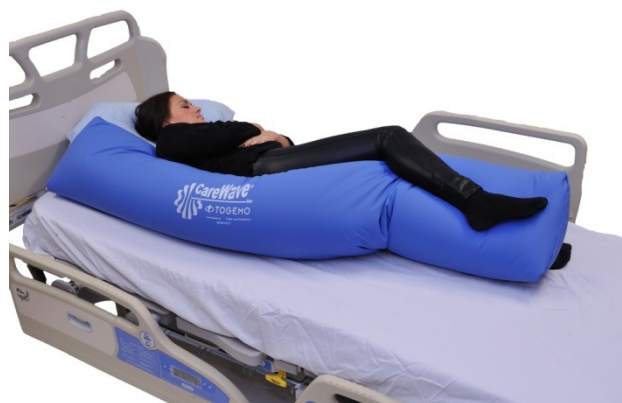
Puter i bruk: 5-NEG1079, NEG0944

Merk at den lange trekantputen 5-NEG1079 ikke er prisforhandlet med NAV.