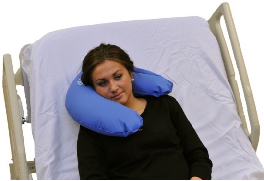
Puter i bruk: NEG0949

Putene med lukking kan gjerne brukes med åpningen i andre vinkler enn i pasientens synsretning. Her forsøker vi å illustrere en pasient med behov for support inder haken i tillegg til sideveis.