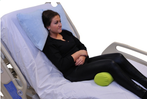
Puter i bruk: NEG0884, NEG0944

Sylinderputen i 2-pack er også ypperlig i bruk for å fiksere og stabilisere bekkenet både i sittende og liggende. Det er viktig å "dytte" putene under pasienten slik at det hviler kroppsvekt på den. Dette gir optimal stabilitet.