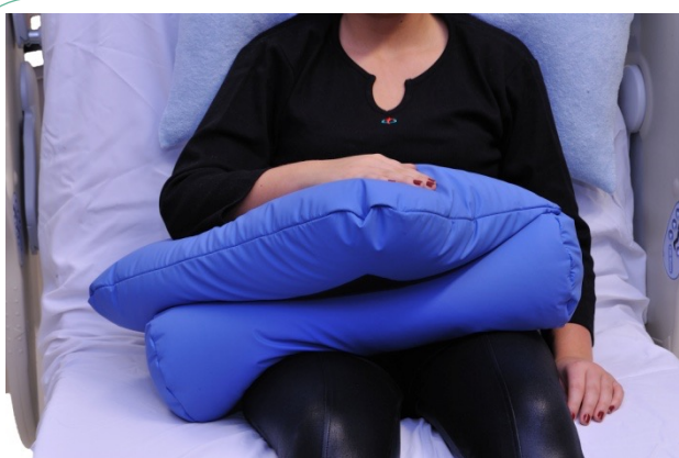
Puter i bruk: NEG 0732, NEG0944

Samme hensikt som bildet ovenfor, men her er semi-fowlerputen lagt andre veien. Dette fører til at leggene får support og at hælene avlastes.