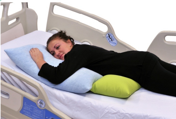
Puter i bruk: NEG0881, NEG0944

Mageleie er ofte en utfordring, men et viktig leie å utnytte når det er mulig. Totalt flatt mageleie vil fungere dårlig for mange av våre brukere, men små posisjonsendringer øker muligheten. Her er en universalpute NEG0881 lagt under bekkenregionen, og den er lagt med mer fyll på venstre, enn høyre side. Slik sikres bedre volum for å optimalisere respirasjon.