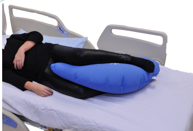
Puter i bruk: NEG0947

Vi glemmer ofte at armene også har stort behov for stabilisering. Her er NEG0947 brukt slik at vi gir både skulder og albueledd nøytral posisjon. NEG0944 med bomullstrekk er brukt bak ryggen for å skape et korrigert sideleie. Høyre arm kunne her også ha vært strukket frem og vært lagt opp på bueputen. Her er det ikke brukt noen puter mellom bena, noe som ville ha bidratt til bedre å beholde kroppen symmetrisk, og med rettere midtlinje.