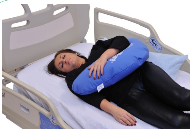
Puter i bruk: NEG0947, NEG0944

Vi glemmer ofte at armene også har stort behov for stabilisering. Her er NEG0947 brukt slik at vi gir både skulder og albueledd nøytral posisjon. NEG0944 med bomullstrekk er brukt bak ryggen for å skape et korrigert sideleie. Høyre arm kunne her også ha vært strukket frem og vært lagt opp på bueputen. Her er det ikke brukt noen puter mellom bena, noe som ville ha bidratt til bedre å beholde kroppen symmetrisk, og med rettere midtlinje.