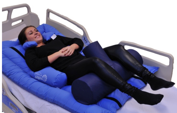
Puter i bruk: 5-NEG0658 – 5-6WP

Ryggleie på kit, og med tilleggsbruk av T-pute som vil forhindre rotasjonsbevegelser. Det er viktig at T'en peker mot lysken for å oppnå ønsket effekt.