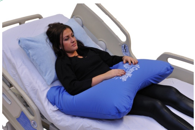
Puter i bruk: NEG0941, NEG0944

Bueputen er her lagt slik at vi får en nøytral posisjon i hofte og kneledd. Samtidig er buens ender skjøvet inn under siden av setepartiet og vil således stabilisere bekkenet. Enden på bueputen ligger også slik at den gir support for underarmene. En universalpute med bomullstrekk er brukt som hodepute.