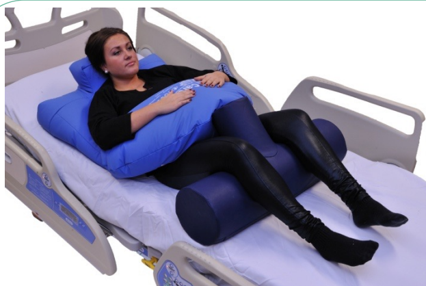
Puter i bruk: 5-6WP, NEG0611, NEG0947

Merk at T-putene ikke er prisforhandlet med NAV.