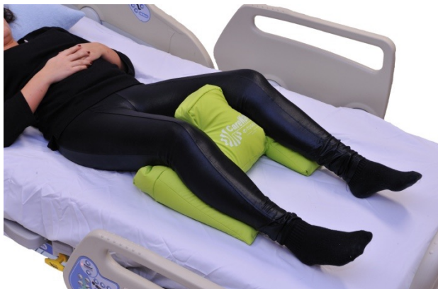
Puter i bruk: NEG0886

Samme hensikt som bildet ovenfor, men her er semi-fowlerputen lagt andre veien. Dette fører til at leggene får support og at hælene avlastes.