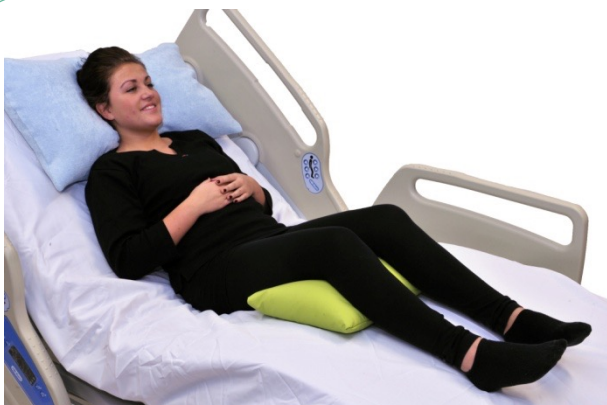
Puter i bruk: NEG0944, NEG0881

Mageleie er ofte en utfordring, men et viktig leie å utnytte når det er mulig. Totalt flatt mageleie vil fungere dårlig for mange av våre brukere, men små posisjonsendringer øker muligheten. Her er en universalpute NEG0881 lagt under bekkenregionen, og den er lagt med mer fyll på venstre, enn høyre side. I tillegg er det lagt en NEG0943 m/bomullstrekk under venstre sides overkropp. Slik sikres bedre volum for å optimalisere respirasjon.