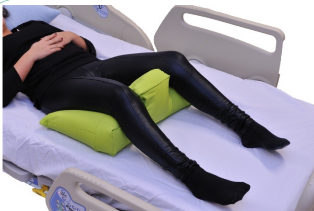
Puter i bruk: NEG0886

Samme hensikt som bildet ovenfor, men her er semi-fowlerputen lagt andre veien. Dette fører til at leggene får support og at hælene avlastes.