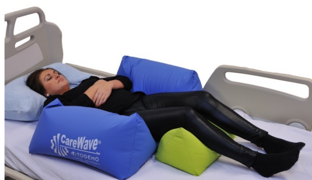
Puter i bruk: NEG0607 x2, NEG0887, NEG0944

Det kan i mange tilfeller være hensiktsmessig å variere hofte og knevinkel. Dynamisk tilnærming er avgjørende, og her har vi utnyttet sengens mulighet for å heve hodegjerdet slik at hofte og knevinkel øker.