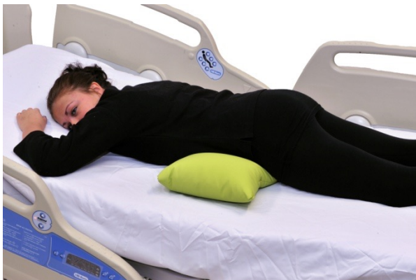
Puter i bruk: NEG0881

I sittende posisjon kan med fordel NEG0606 2-pack brukes for å fiksere bekkenet. Dette vil stabilisere bekkenet i ønsket sittevinkel, og forbygge tilting av bekkenet slik at pasienten ender i "banan" posisjon. NEG0942 er brukt øverst thorakalt for å gi pasienten bedre support for bedre å kunne bære hodet. Den er også plassert slik at den gir stabilitet for nakken. NEG0944 er lagt i fanget for å stabilisere armene via support i underarmene. En buetepute kunne også vært brukt i fanget.