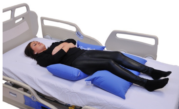
Puter i bruk: NEG0944 og NEG0606

Universalputene kan utmerket brukes som hodepute. Velg rett størrelse til den enkelte pasient slik at fyllingsgrad og størrelse gir ønsket stabilitet. Universalputene kan brukes like bra for stabilisering av hode og nakke i ryggleie, korrigerende sideleie og sideleie. Det vil nesten alltid være en fordel å utstyre puten brukt som hodepute med tilhørende bomullstrekk. I produktlisten finner du artikkelnummer og NAV sitt hjelpemiddelnummer.