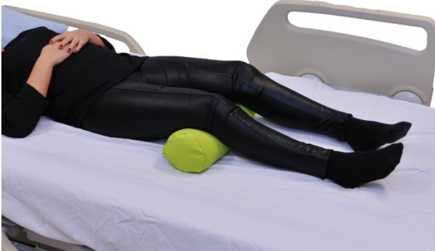
Puter i bruk: NEG0884

NEG0884 brukt i den hensikt å forhindre overstrekk av kneledd. Bør brukes i et dynamisk program slik at leddvinkler endres rutinemessig.